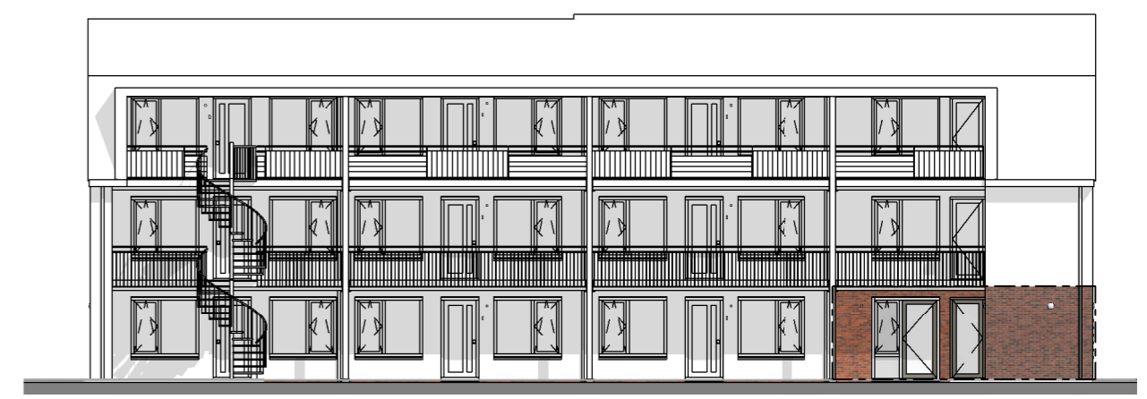
Appartement 01 Type A