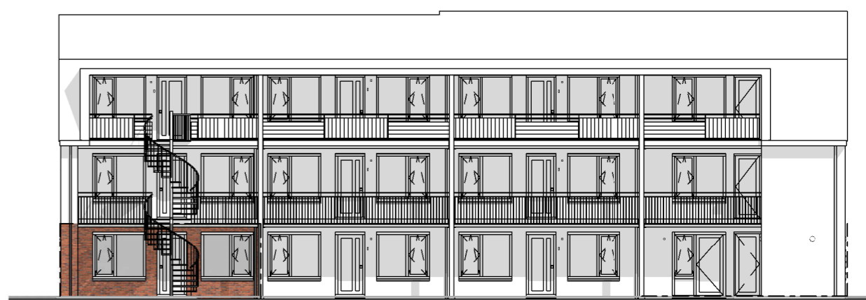
Appartement 04 Type C