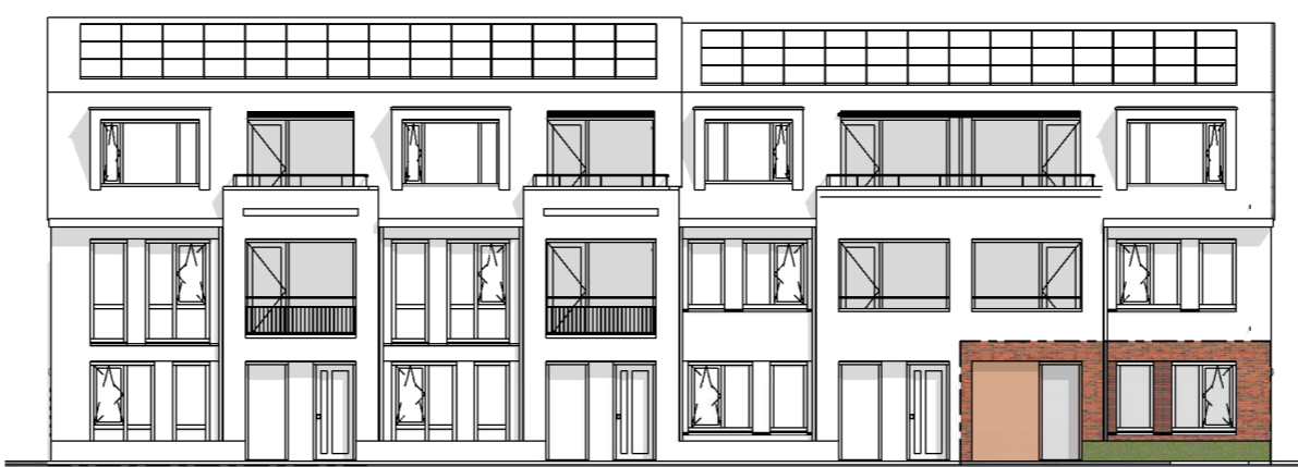
Appartement 01 Type A